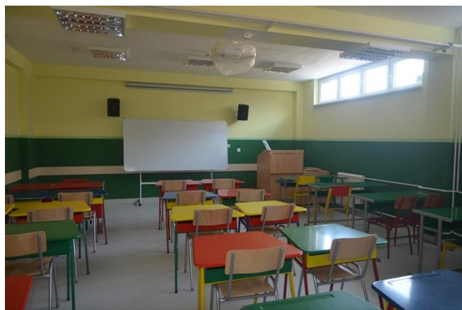
Медиатека преуређена у учионицу