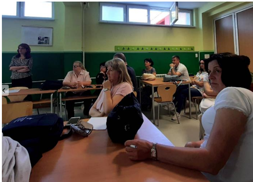
Наши наставници на семинару.