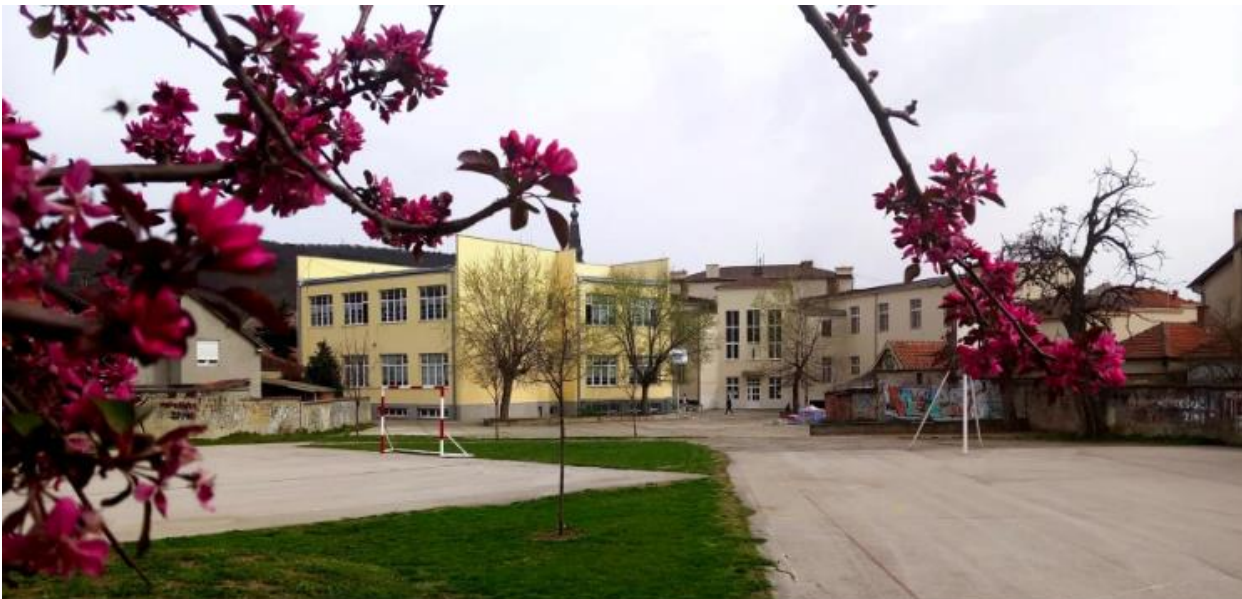
Школа, школско двориште и спортски терени.