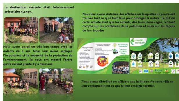
Слике из презентације са учешћа наше школе у пројекту Зелена школа.

У складу са основним циљевима и задацима Школског развојног плана приоритет у укључивању у међународне пројекте ће имати интердисциплинарни приступ часовима. Потреба за укључивањем у ову врсту пројеката јавила се због тога што је потребно школу учинити практичнијом, смисленијом и применљивијом на проблеме који се јављају у свакодневном животу, тј. примена наученог из разних области.