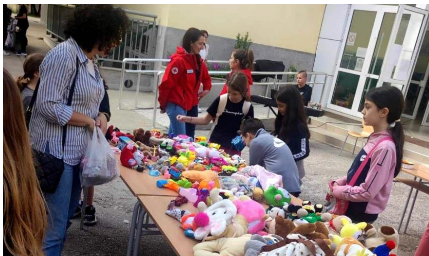
Традиционални хуманитарни базар у дворишту наше школе.