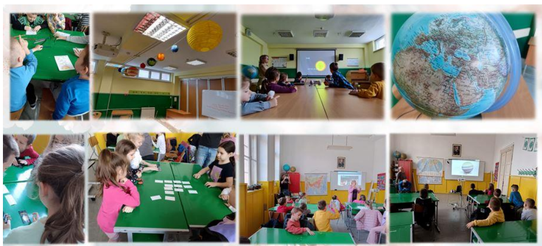
Учење кроз игру и истраживање

У наредном периоду бићемо посвећени унапређивању свих аспеката образовања и васпитања у складу са развојним постигнућима савремене педагогије и методологије рада у разредној и предметној настави. Наше капацитете усмерићемо на јачање сарадње и оспособљавање за тимски рад, повезујући све битне актере у развоју и образовању младих, почев од актера укључених у припремни програм предшколског образовања и васпитања, па до актера релевантних током основног образовања и васпитања. Развијаћемо механизме за квалитетан подстицај и укључивање родитеља у процесе образовања и васпитања ученика и рад школе. Руководство школе ће наставити са залагањима у погледу осавремењавања услова школовања и стварању безбедних и подстицајних услова рада и укључивања ученика и наставника у различите пројекте сарадње са домаћим и иностраним партнерима.