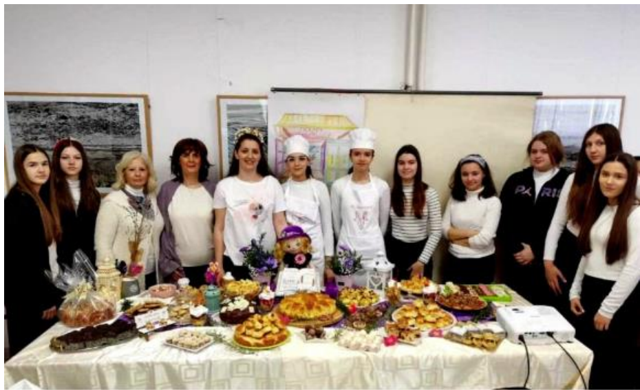
Сарадња са биотехнолошком школом „Шуматовац“, штанд наше школе на њиховој манифестацији „Пекарски дани“.