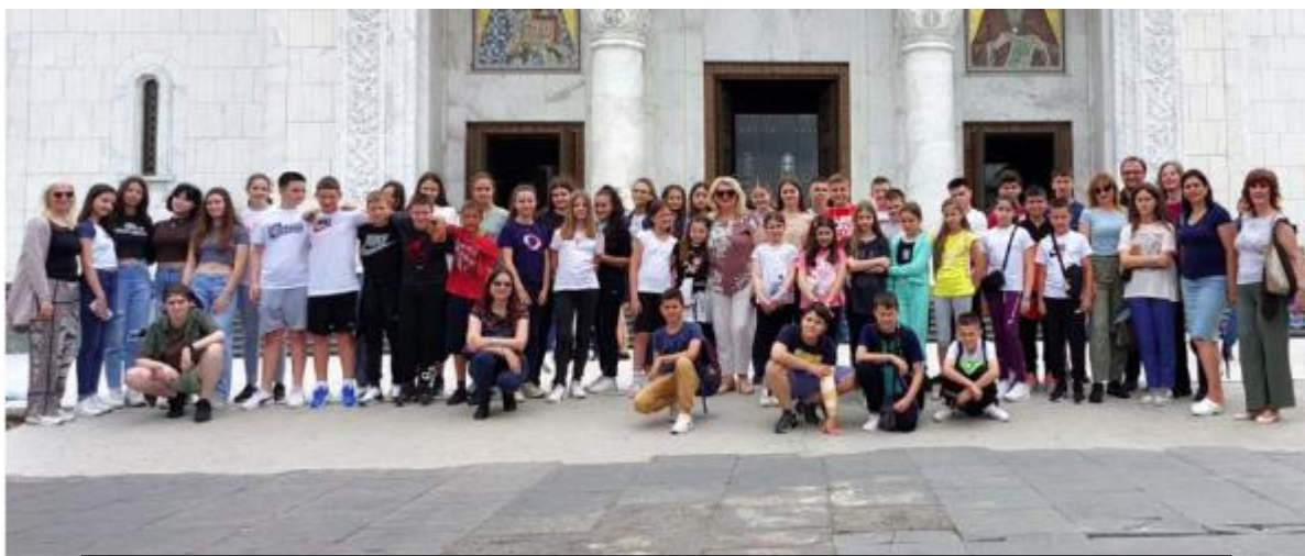
Традиционална наградна екскурзија ученика најуспешнијих такмичара