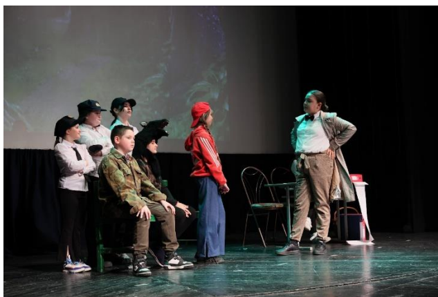
Хуманитарна представа наше драмске секције