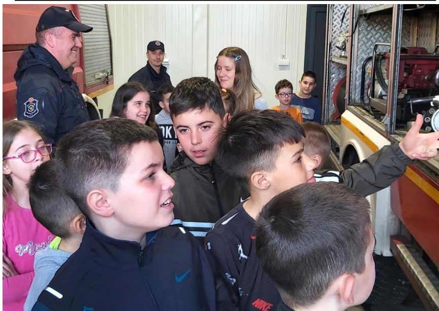
Отац једног ученика упознао ученике са послом ватрогасца уз разгледање ватрогасне станице