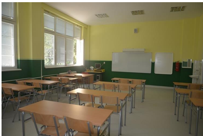
Једна од учионица у новом делу школе