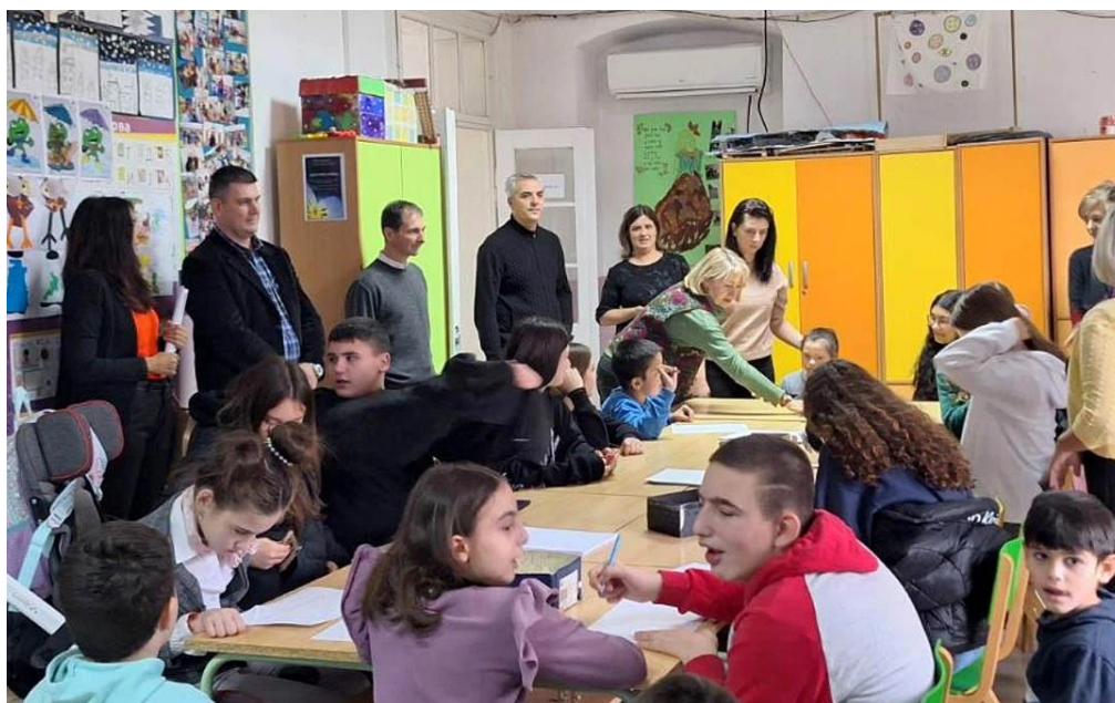
Сарадња са основном школом „Смех и суза“, за ученике са сметњама у развоју. Посета наших ученика и заједничка