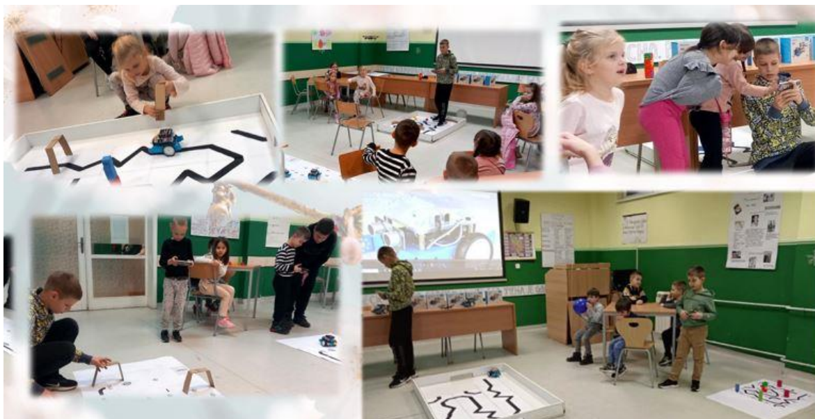
Почетни кораци у дигиталном описмењавању на примеру пројектне наставе. Програмирање робота и дронова.